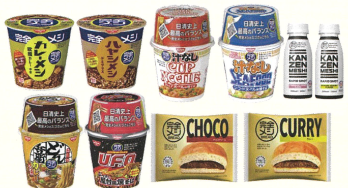
お届けする食品（※一部変更の可能性あり）

食事のお届けと一緒に夏休みの 思い出になる楽しいイベントも 用意しています★ ぜひご応募ください！